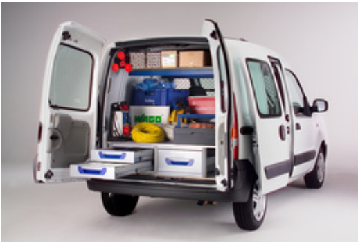
Fahrzeugeinrichtung für die Branche Elektro